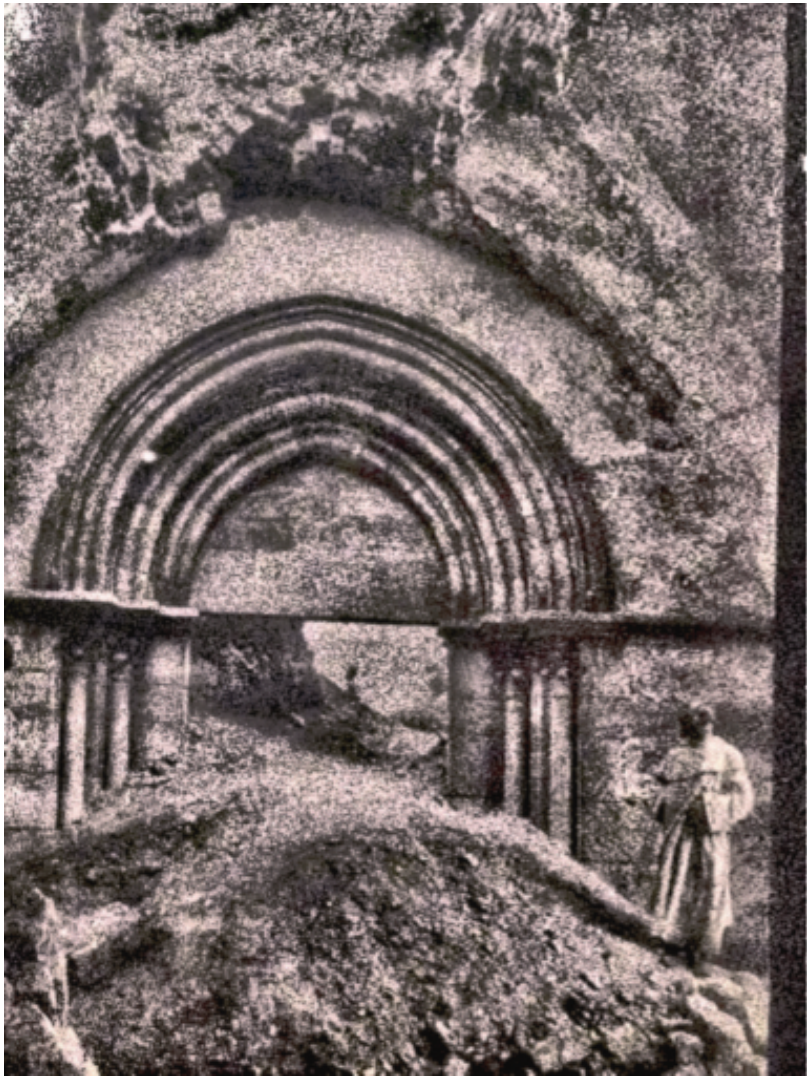
gaza in trümmern seit 1917